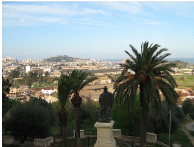
Annaba sous le regard de Saint Augustin

C'est à la Basilique Saint Augustin (354-431) de cette ville que se trouvent des reliques de ce saint.